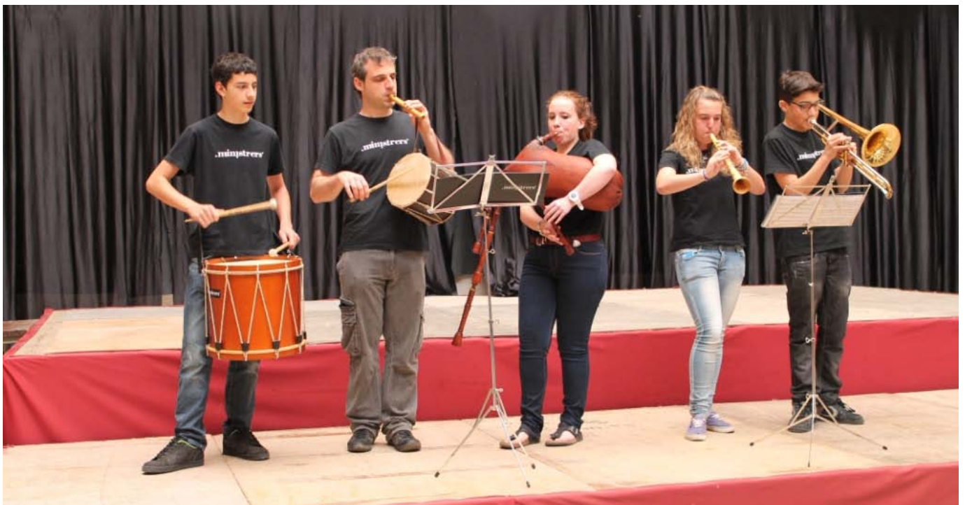
Els Ministrers d'Olot característic!

Amb molta alegria i xerrant de tot el que havíem viscut aquell matí ens vàrem desplaçar cap al Museu Comarcal de la Garrotxa on ens esperaven tota una mostra de la imatge festiva d'Olot per poder-la tocar, veure,... ah, i a més el grup de música tradicional de l'escola de Música Municipal, els Ministrers, ens van fer gaudir de la música en directe amb el seu sac de gemecs, la seva tarota, el seu flabiol i tamborí, ... quin so més