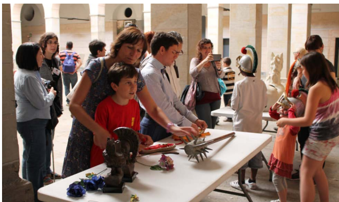
Coneixent la Faràndula d'Olot

Els músics es van apropar a tots als oients de la família de "Música a les mans" i ens van explicar com eren aquests instruments del nostre folklore, els vam poder tocar i fins hi tot fer sonar.