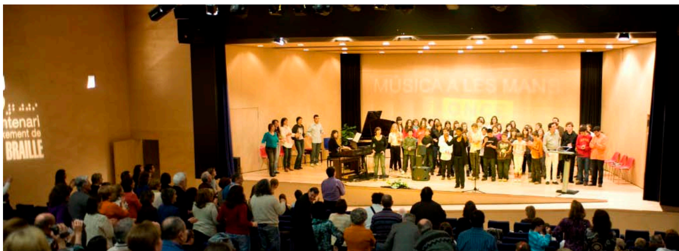
Barcelona 3 a trobada al 2009

Aquest any la trobada l'hem fet a la ciutat d'Olot. Una ciutat ubicada en la comarca de la Garrotxa i on un alumne de vuit anys que estudia música ens ha portat a conèixer i a viure